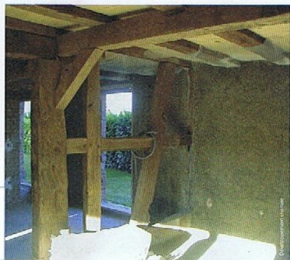
Les enduits isolants chaux-chanvre respectent l'équilibre hygrothermique du bâti ancien.

Mortier et béton sont composés de granulat, de liant et d'eau. Mais on parle de béton lorsque le mélange est mis en œuvre en forte épaisseur (mur, dalle) ; on emploie le terme de mortier lorsque le mélange n'est qu'un complément de maçonnerie (jointoiement, enduit).