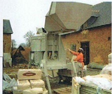
Grâce aux récents progrès de la mécanisation, quelques jours suffisent pour réaliser une maison presque 100 % béton de chanvre.