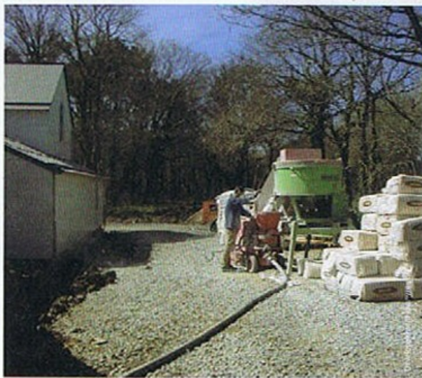
Une nouvelle machine à projeter le chanvre sera commercialisée en 2008. Principale innovation : la diminution des quantités d'eau nécessaires.

(3) Pour les bétons de chanvre ces chiffres doublent voire triplent après plusieurs mois de séchage.