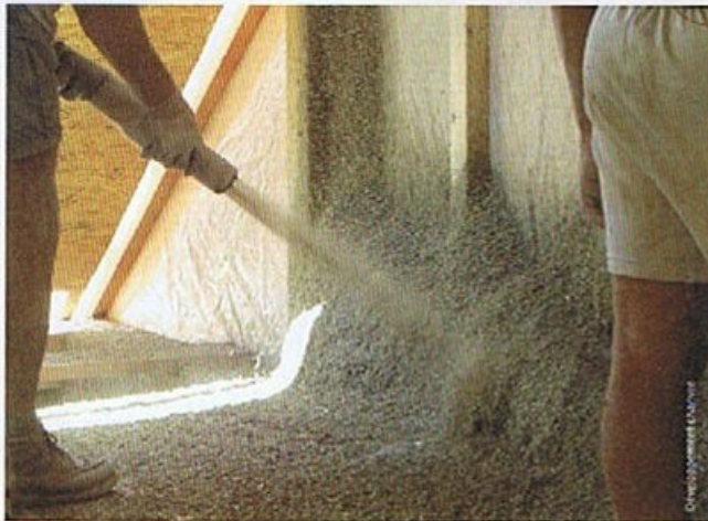
La projection mécanisée du béton de chanvre s'adapte à la réalisation de murs mais aussi de dalle, d'isolation de toiture.